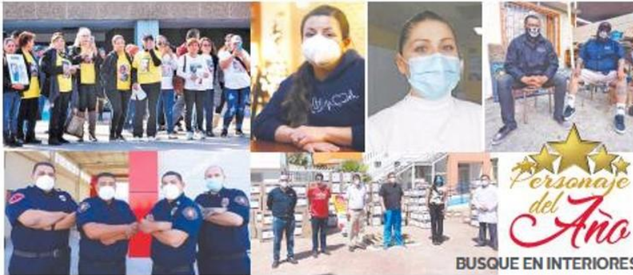
BUSQUE EN INTERIORES

POLICIA SUMAN 10 POLICIAS MUERTOS POR COVID. 19